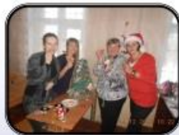
В гости к нам приехал настоящий Санта Клаус!